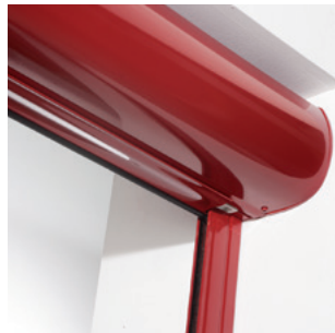
Fermeture totale du coffre en position ouverte.