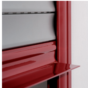
Design exclusif de la lame finale, galbée et discrète.